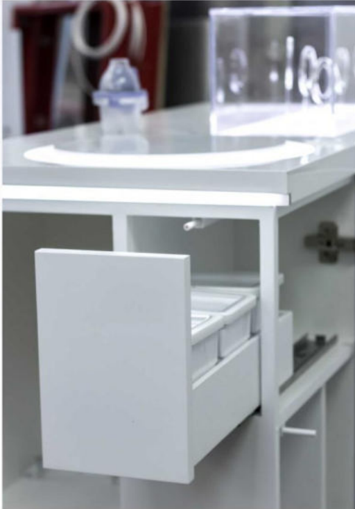
Fiók az üres Kapszulák tárolásához