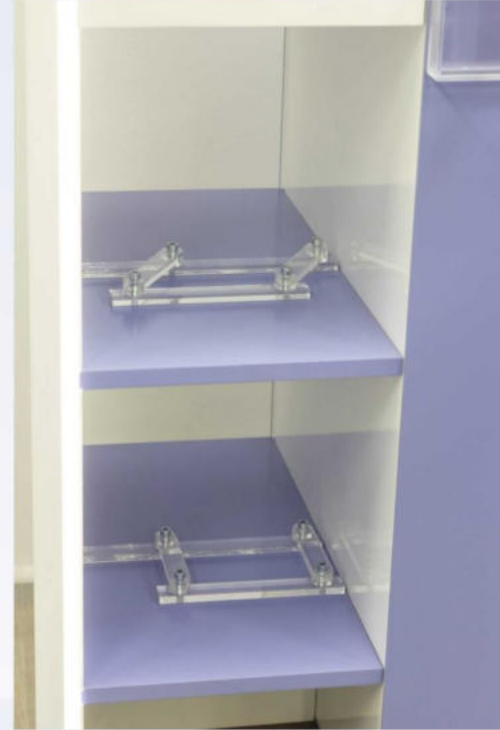
Plexielemek a fakkok mélységének szabályozásához