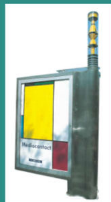
Ezek az illusztrációk az Oktogon Magazin 2002/4-es számában találhatóak.